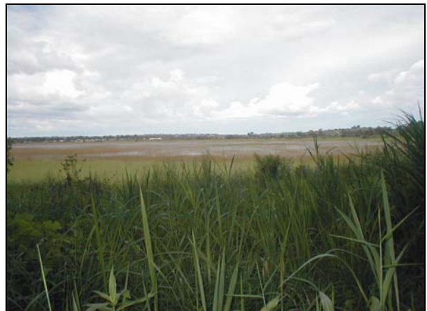
Figure 2 : Lac de Dang marqué par l'envasement et l'eutrophisation (photo Ngounou Ngatcha, octobre 2006).

Le présent travail vise à évaluer l'état de l'envasement de ce lac situé dans la zone de transition entre le Sud du Cameroun humide et le Nord semi-aride. Il s'appuie sur un suivi amorcé en 2004 dans la perspective de développement des recherches sur les régimes hydrologiques et les régimes des éléments dissous et particuliers au niveau des retenues et barrages existants dans le Grand Nord du Cameroun (entre 7^\circ et 12^\circ N).