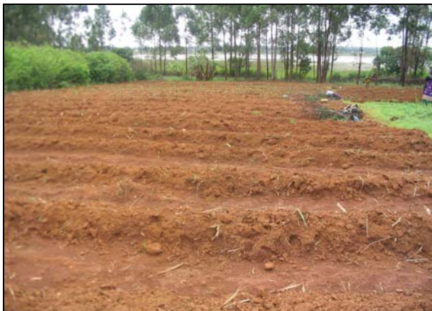
Figure 3 : Parcelle agricole de culture de contre-saison autour du lac de Dang (Photo Ngounou Ngatcha, oct. 2006).

Le sol de la région est de type ferralitique avec majoritairement des sols rouges formés sur basaltes anciens (Fig. 3).